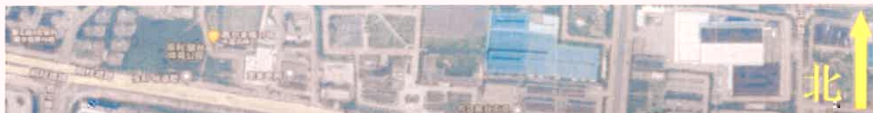
附图2：采样点位示意图